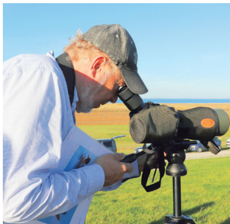
Alles im Blick: Mit dem Spektiv – eine Mischung aus Teleskop und Fernglas – kann man hervorragend Vögel beobachten.

■ Allgemeines: Viele Vereine und Einrichtungen beteiligen sich an den Zugvogeltagen, etwa das Nationalpark-Haus Wangerland, www.nationalparkhaus-wattenmeer.de .